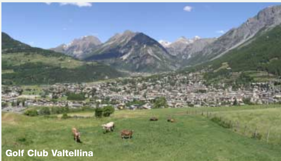
Golf Club Valtellina

Prima colazione in Hotel. In mattinata trasferimento con mezzi propri (circa 50 km, nei pressi di Sondrio) al Valtellina Golf Club a Caiolo. E' un altro 9 buche ma par 72 con buche lunghe per allenare il drive. Entrambi i campi, caratterizzati da brezze leggere, consentono di praticare lo sport preferito anche durante i mesi estivi. Gara Audi Quattro Cup, 18 buche Stableford. Cena con amici al Circolo. Rientro con mezzi propri.